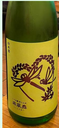
↑秋とんぼ 楽風舞 (製造 2023.08)